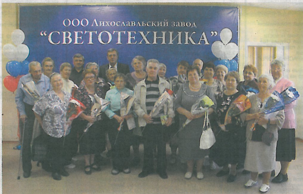
Ветераны завода на празднике «День машиностроителя»