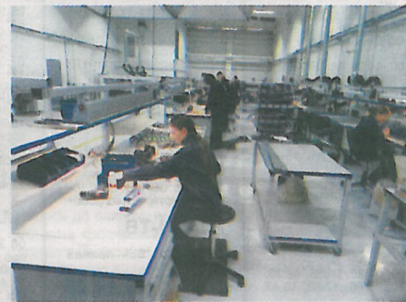
Участок сборки современных светодиодных светильников

В 2009 – 2011 годах продолжается техническое перевооружение, организован участок светодиодных светильников, ведется строительство новой автоматизированной модульной котельной завода. Продукция завода выпускается из материалов, отвечающих современным требованиям, устойчива к коррозии, отличается высоким качеством и хорошим дизайном. Для изготовления светильников на заводе освоены все виды производств.